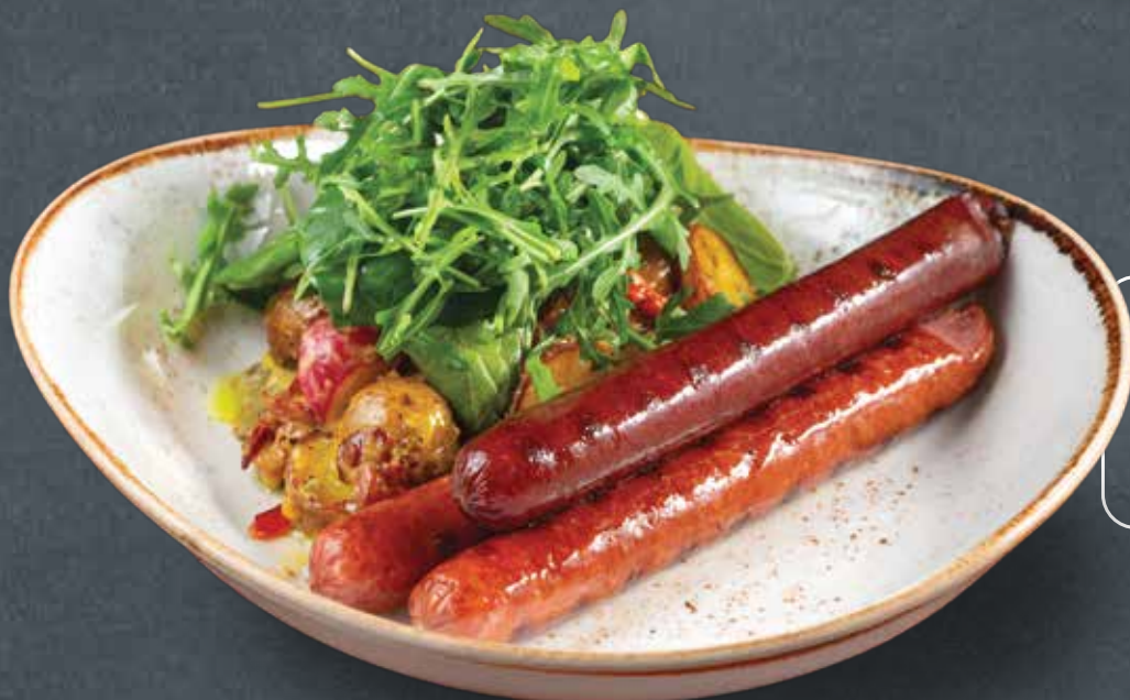
АССОРТИ КОЛБАС С КАРТОФЕЛЬНЫМ САЛАТОМ 1250 ASOORTED SAUSAGES