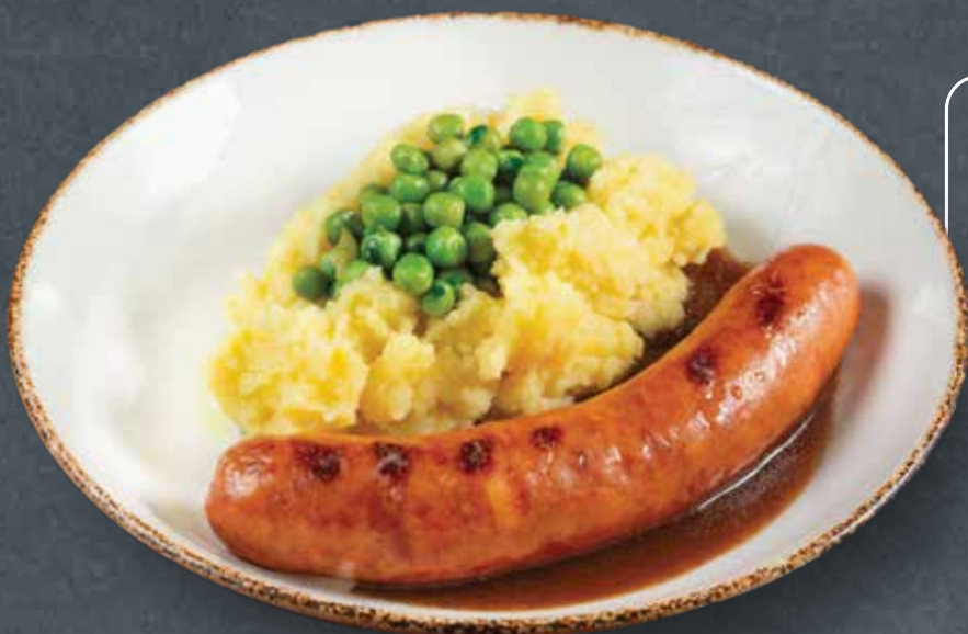
СВИНАЯ КОЛБАСКА С СЫРОМ 750 PORK SAUSAGE WITH CHEESE с толчёным картофелем и молодым горошком