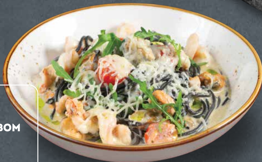
ЧЁРНЫЕ СПАГЕТТИ С КРЕВЕТКАМИ И МИДИЯМИ В КОКОСОВОМ СОУСЕ 990 BLACK SPAGHETTI WITH SHRIMP AND MUSSELS