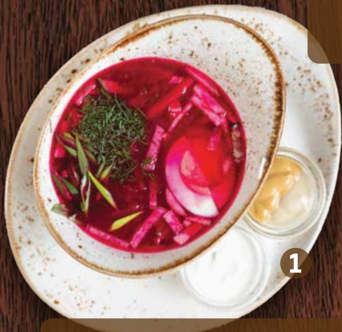
1. ХОЛОДНЫЙ БОРЩ 420 Cold Borsch