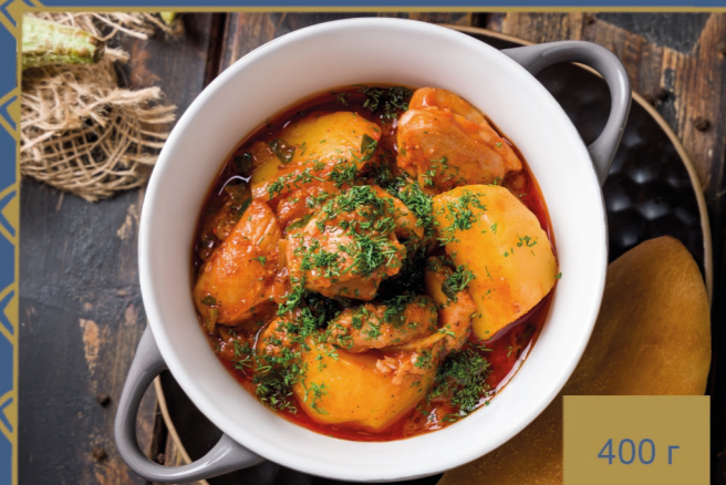
СОУС ПО-СУХУМСКИ 550р

КУРИЦА, КАРТОФЕЛЬ, ЛУК, ЗЕЛЕНЬ, СПЕЦИИ В ТОМАТНОМ СОУСЕ, ЗАПЕЧЕННЫЕ В ГОРШОЧКЕ