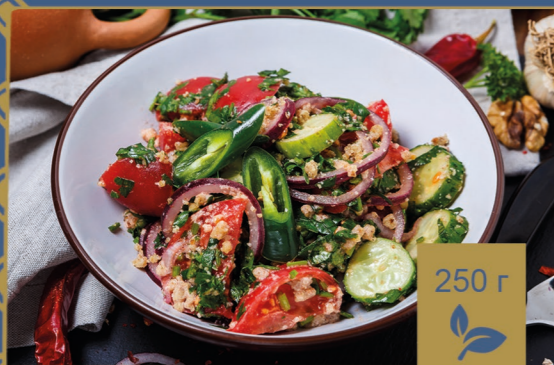
САЛАТ ПО-ГРУЗИНСКИ 390р