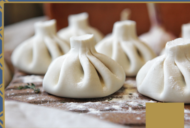
ХИНКАЛИ 90 г/шт