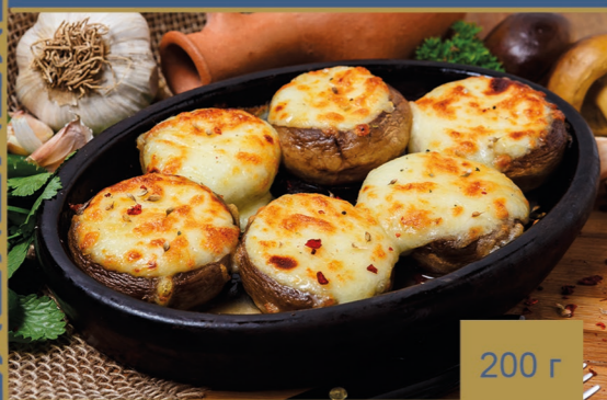
ШАМПИНЬОНЫ С СЫРОМ 430р