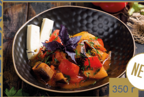
АДЖАПСАНДАЛИ ПО-ДЕРЕВЕНСКИ 490р