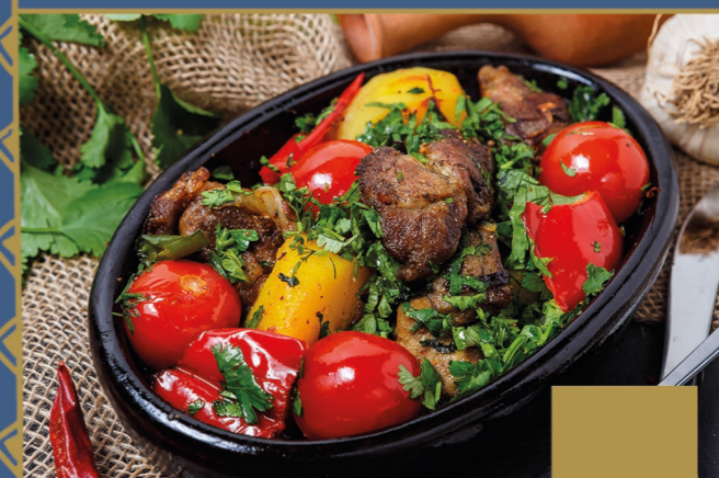
ОДЖАХУРИ 350 г

КУРИЦА, КАРТОФЕЛЬ, ЛУК, ЗЕЛЕНЬ, СПЕЦИИ В ТОМАТНОМ СОУСЕ, ЗАПЕЧЕННЫЕ В ГОРШОЧКЕ