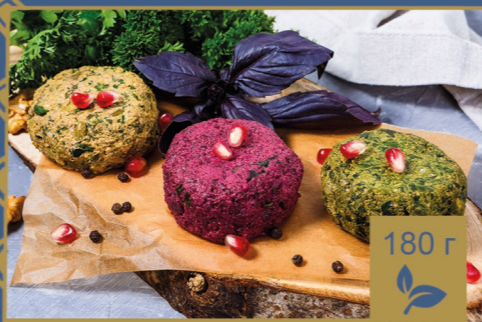
ПХАЛИ АССОРТИ 400р

ШПИНАТ, ЗЕЛЕНАЯ ФАСОЛЬ, СВЕКЛА, ЗАПРАВЛЕННЫЕ ГРЕЦКИМ ОРЕХОМ СО СПЕЦИЯМИ