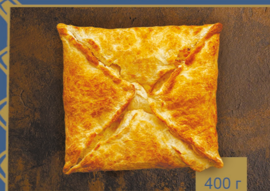
ПЕНОВАНИ СЛОЕНОЕ ТЕСТО, СЫР