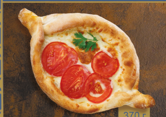
ПО-АДЖАРСКИ С ПОМИДОРАМИ