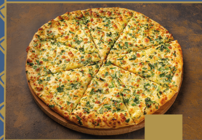
ХАЧАПУРИ С ЗЕЛЕНЬЮ