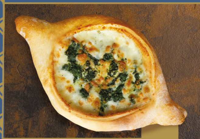
ПО-АДЖАРСКИ СО ШПИНАТОМ