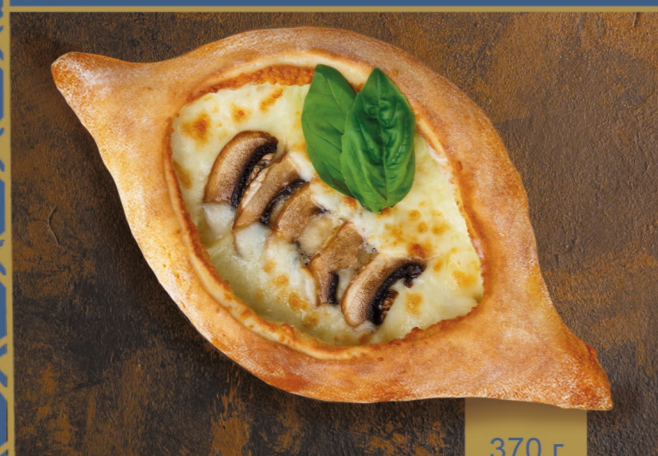
ПО-АДЖАРСКИ С ГРИБАМИ