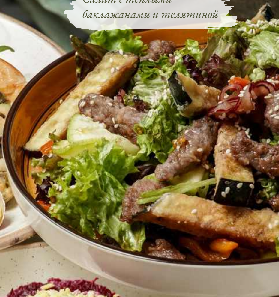
Салат с теплыми баклажанами и телятиной