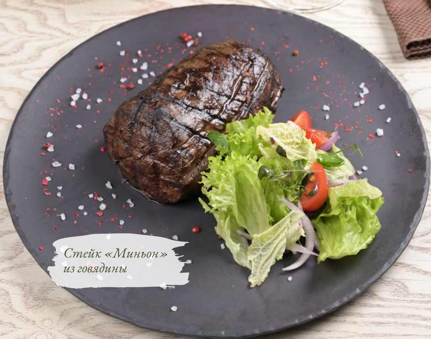
Стейк «Миньон» из говядины