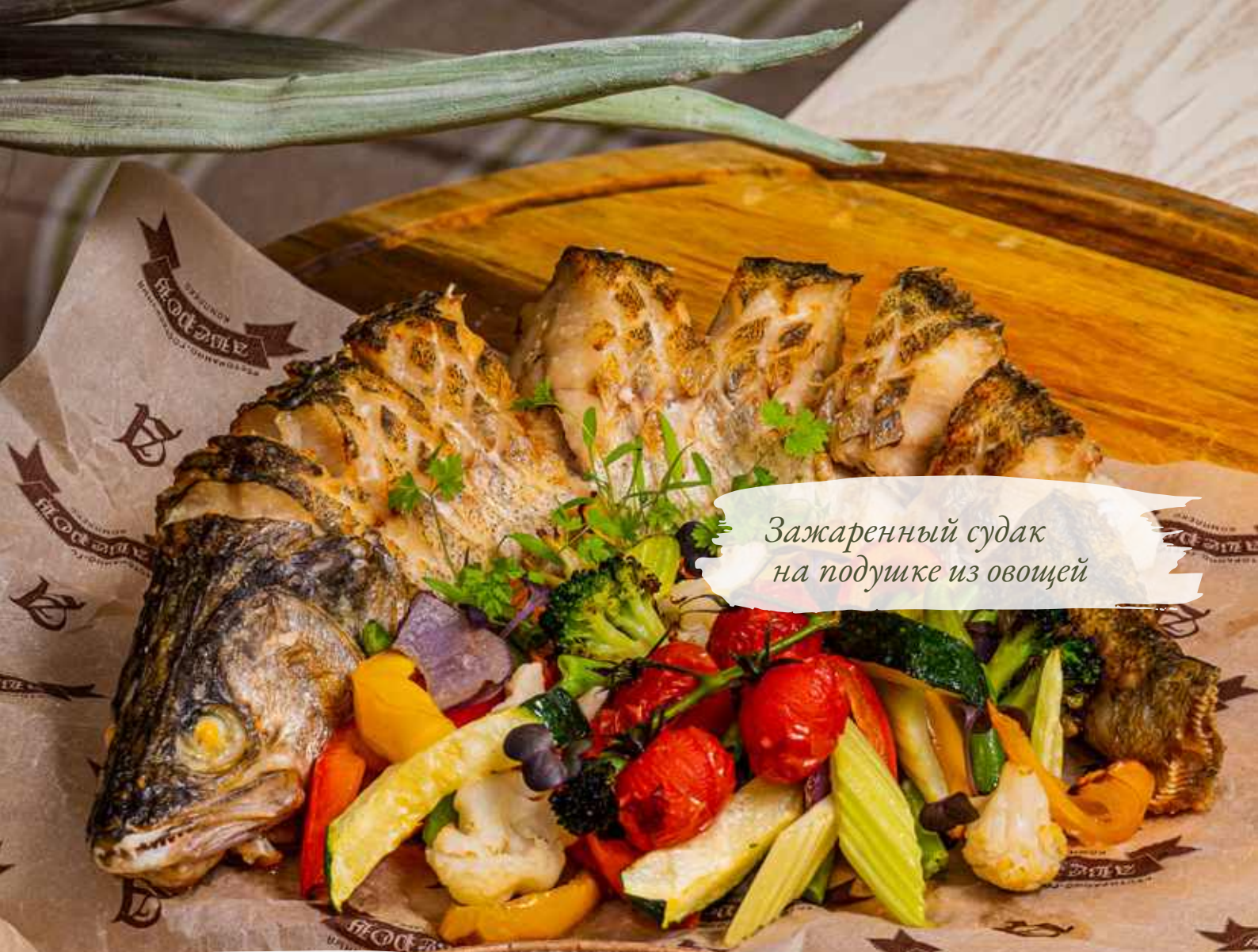
Зажаренный судак на подушке из овощей