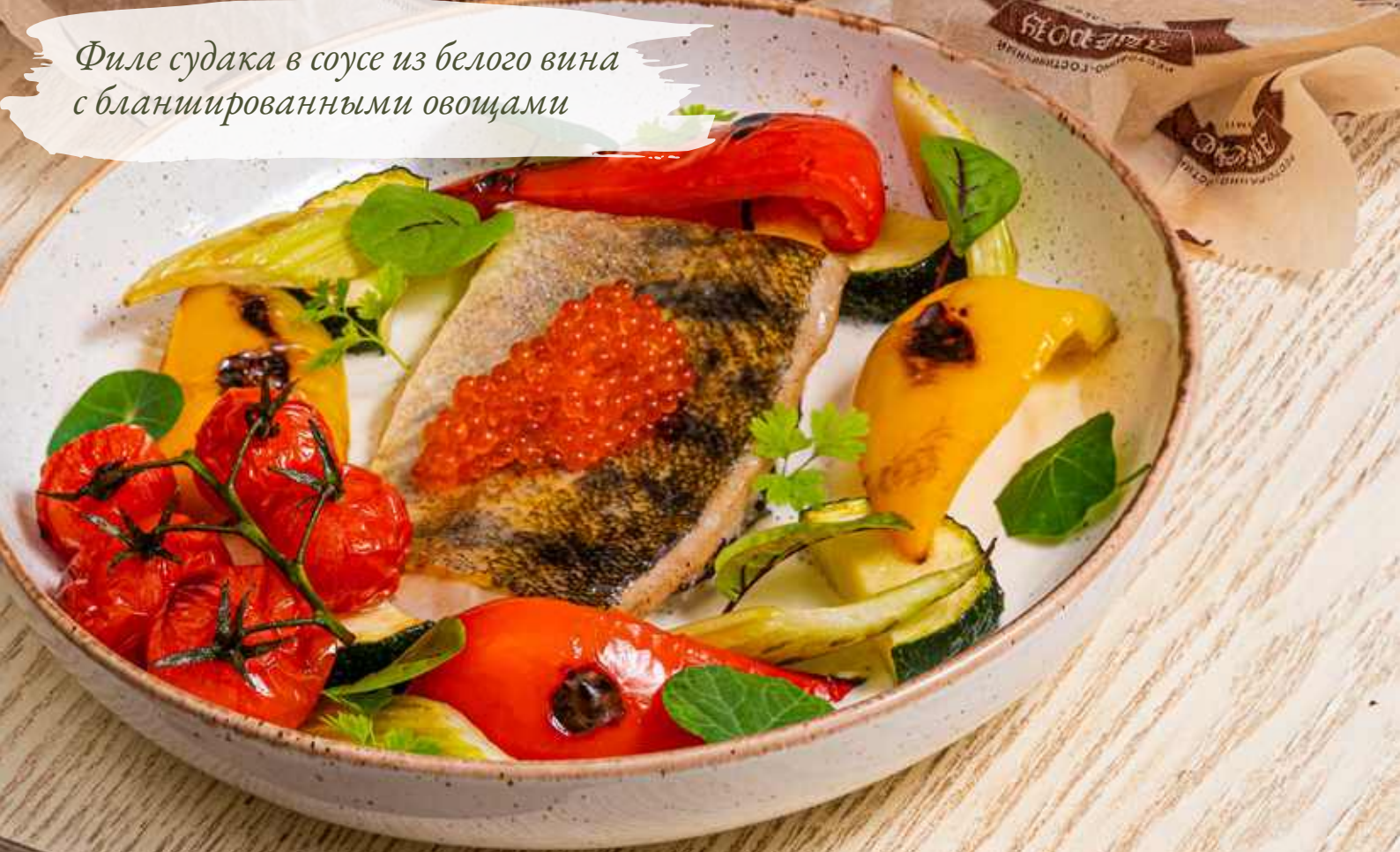
Филе судака в соусе из белого вина с бланшированными овощами