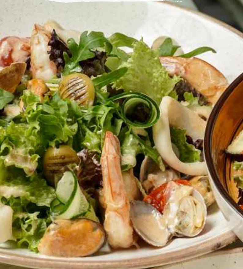
Теплый салат из морепродуктов