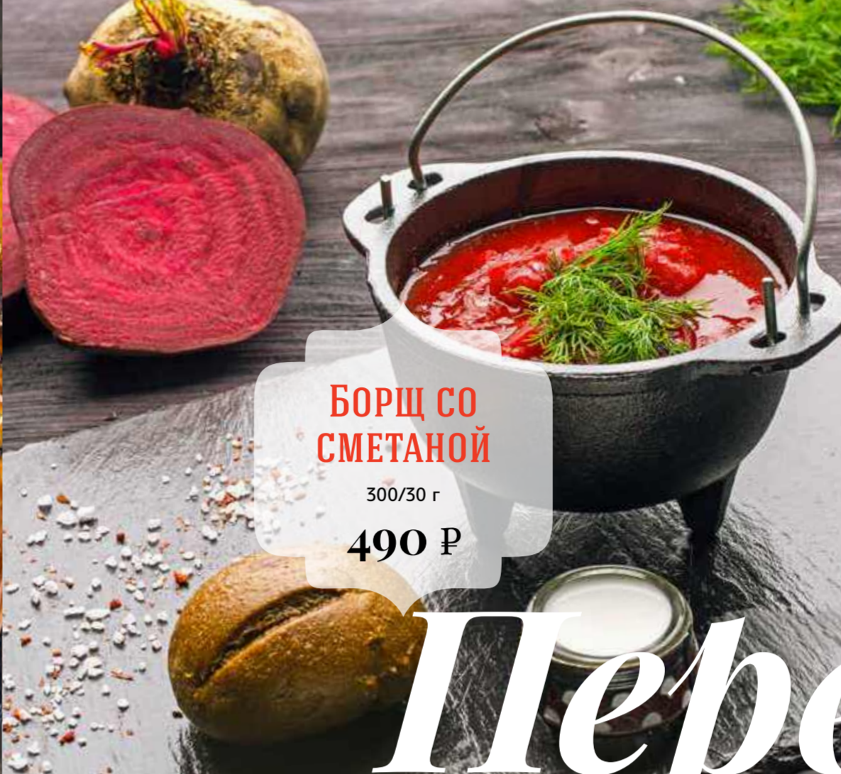
БОРЩ СО СМЕТАНОЙ 300/30 г 490 Р