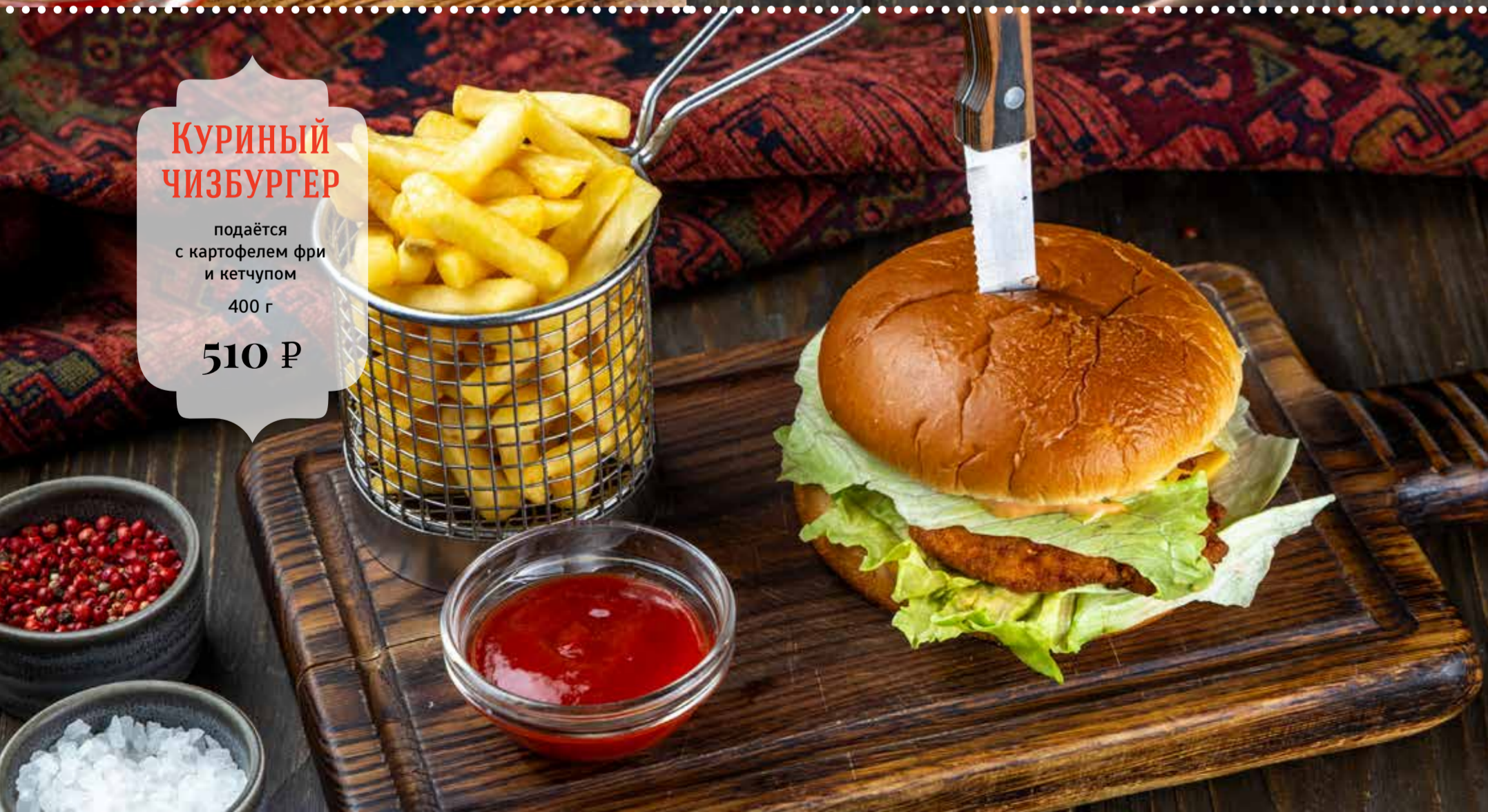
КУРИНЫЙ ЧИЗБУРГЕР подаётся с картофелем фри и кетчупом 400 г 510 Р