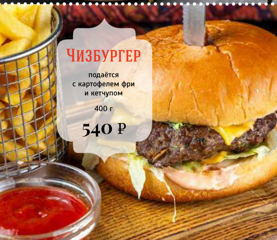
ЧИЗБУРГЕР подаётся с картофелем фри и кетчупом 400 г 540 Р