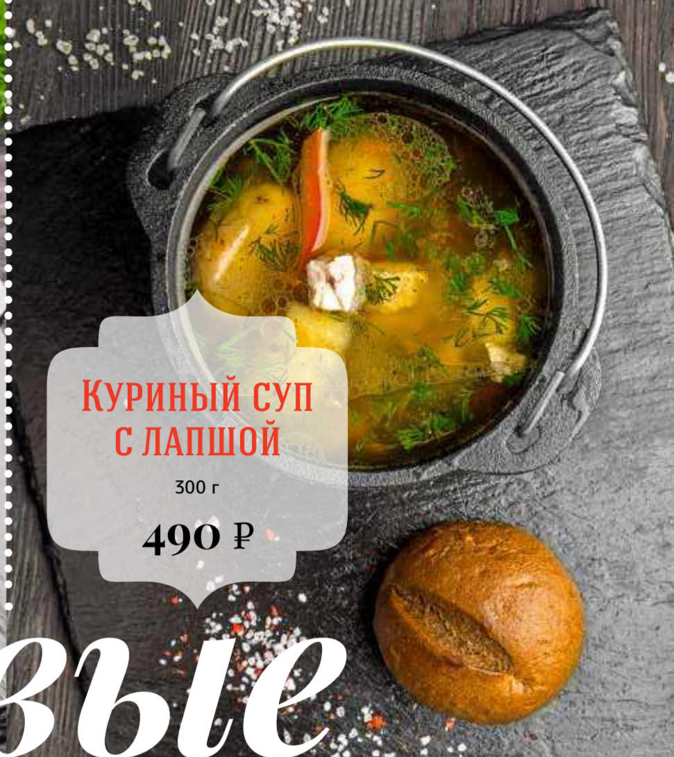
КУРИНЫЙ СУП С ЛАПШОЙ 300 г 490 Р