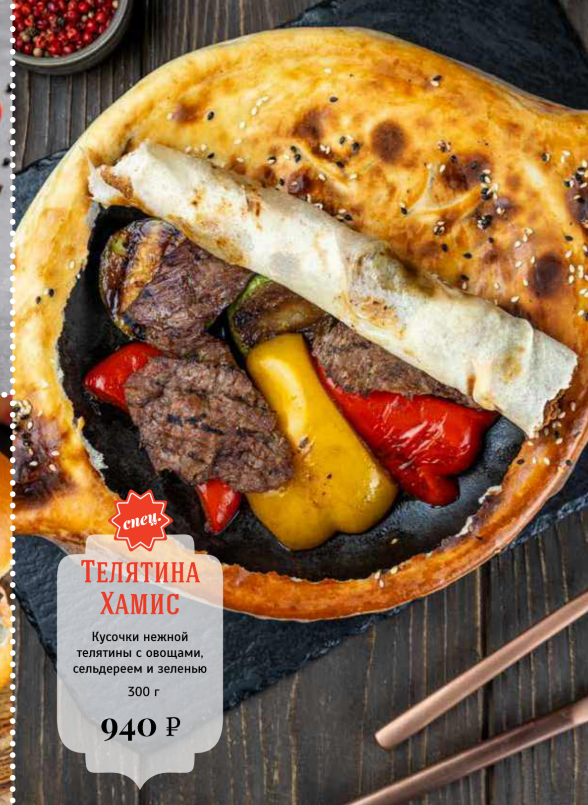
спец ТЕЛЯТИНА ХАМИС Кусочки нежной телятины с овощами, сельдереем и зеленью 300 г 940 Р