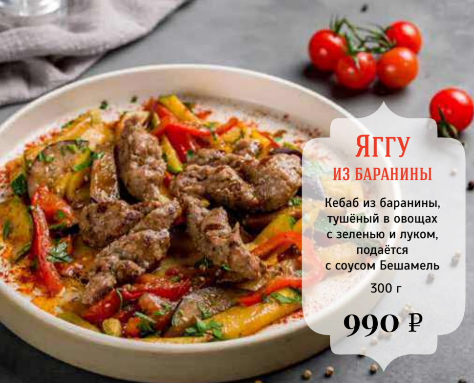
ЯГГУ ИЗ БАРАНИНЫ Кебаб из баранины, тушёный в овощах с зеленью и луком, подаётся с соусом Бешамель 300 г 990 Р