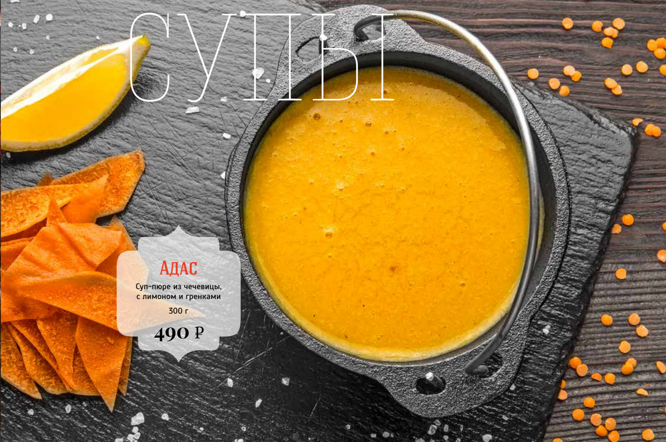
АДАС Суп-пюре из чечевицы, с лимоном и гренками 300 г 490 Р