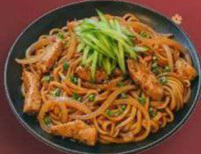
3.1. Удон с Курицей 369 Р

330 г - Свежая лапша, шеф соус, зелёный лук, курицей, репчатый лук, огурец