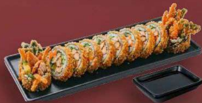
5.4. Жареный кимпаб с Курицей 359 Р

200 г - Рис, нори, курицей, редька маринованная, морковь, огурец, салат, соевый соус