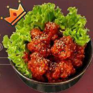
6.1. Чиккен по-корейски 419 Р

280 г - Курица в панировке, соус по-корейски, белый кунжут, черный кунжут, нори