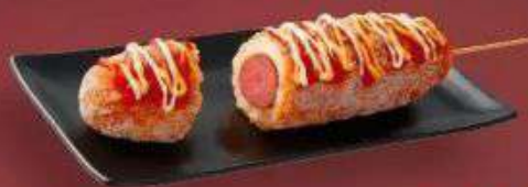
6.4. Хотдог классический 249 Р

150 г - Креветки в панировке (5 шт.), салат