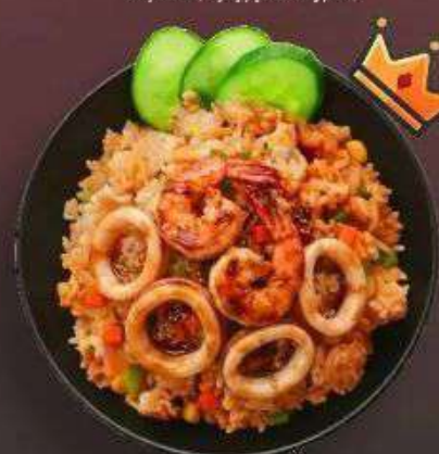
4.4. Жареный рис с Морепродуктами 429 Р

340 г - Рис, фрайд чиккен, соус терияки, лук, морковь, кукуруза, огурец