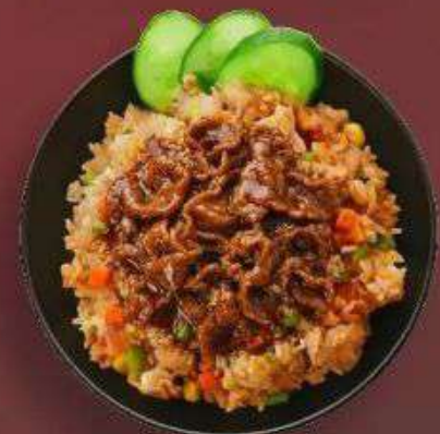
4.2. Жареный рис с Говядиной 399 Р

330 г - Рис, курица, шеф соус, лук, морковь, кукуруза, огурец