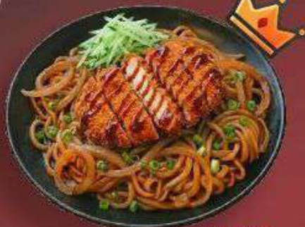
3.3. Удон Фрайд 389 Р

330 г - Свежая лапша, шеф соус, зелёный лук, говядина, репчатый лук, огурец