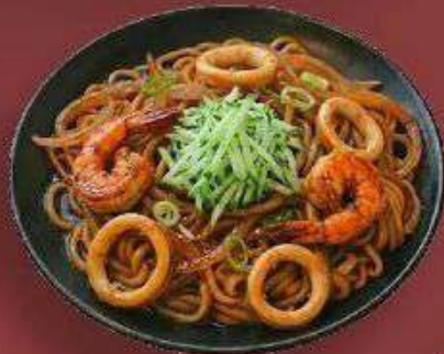
3.4. Удон с Морепродуктами 419 Р

340 г - Свежая лапша, шеф соус, фрайд чиккен, зелёный лук, соус терияки, репчатый лук, огурец