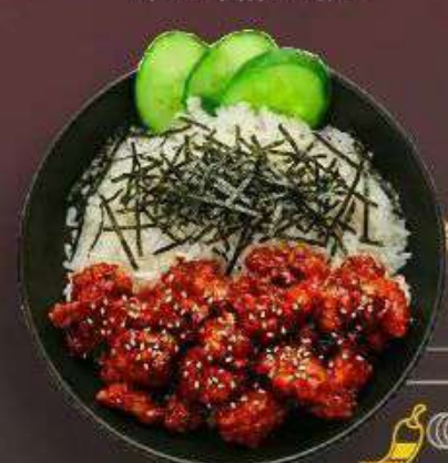
4.5. Рис с Курицей по-корейски 389 Р

340 г - Рис, креветки, кальмар, шеф соус, лук, морковь, кукуруза, огурец