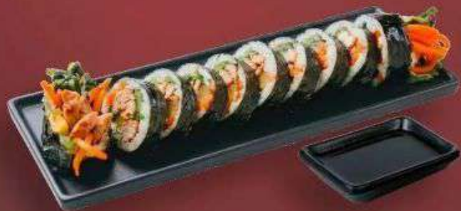
5.3. Кимпаб с Курицей 339 Р

220 г - Рис, нори, говядина, редька маринованная, морковь, огурец, салат, сухари панировочные, соевый соус