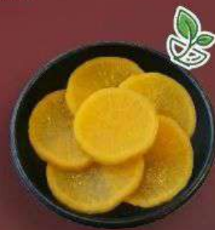
6.8. Такуан 189 Р

200 г - Рис, креветки, майонез, нори, масло кунжутное