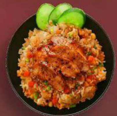
4.1. Жареный рис с Курицей 379 Р

330 г - Рис, курица, шеф соус, лук, морковь, кукуруза, огурец