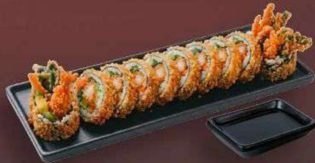
5.6. Жареный кимпаб с Креветками 399 Р 🌸

210 г - Рис, нори, темпура с креветкой, редька маринованная, морковь, огурец, салат, соевый соус