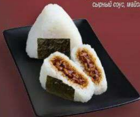
6.6. Онигири с тунцом 279 Р

180 г - Сосиска, сыр Моцарелла, мука, дрожжи, кетчуп, сырный соус, майонезный соус