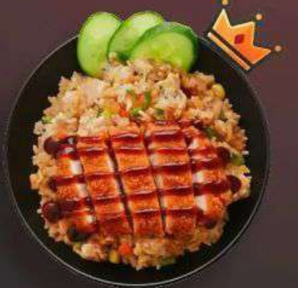
4.3. Жареный рис с Фрайд чиккен 399 Р

330 г - Рис, говядина, шеф соус, лук, морковь, кукуруза, огурец