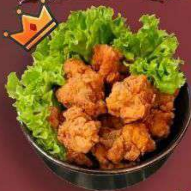
6.2. Чиккен в панировке 379 Р

280 г - Курица в панировке, соус по-корейски, белый кунжут, черный кунжут, нори