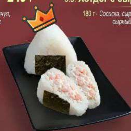
6.7. Онигири с креветками 319 Р

200 г - Рис, тунец, майонез, нори, масло кунжутное