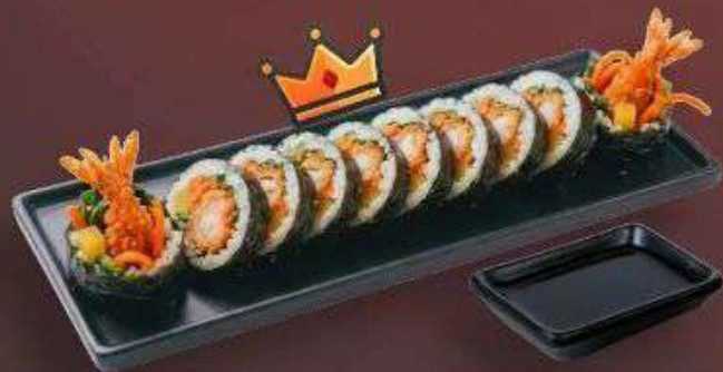
5.5. Кимпаб с Креветками 379 Р

220 г - Рис, нори, курицей, редька маринованная, морковь, огурец, салат, сухари панировочные, соевый соус