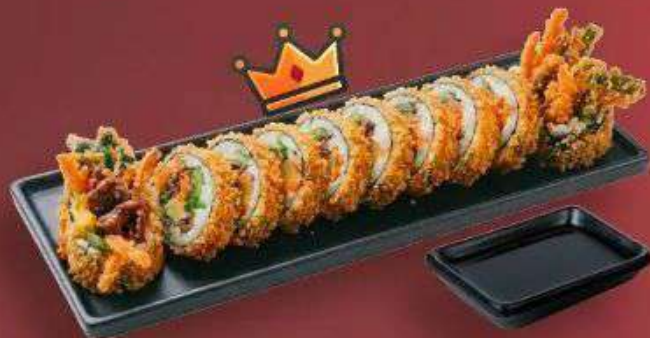
5.2. Жареный кимпаб с Говядиной 379 Р

200 г - Рис, нори, говядина, редька маринованная, морковь, огурец, салат, соевый соус