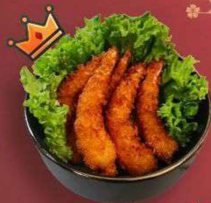
6.3. Креветки темпура 469 Р

150 г - Креветки в панировке (5 шт.), салат