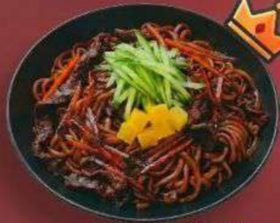
3.5. Чачанмён 409 Р

340 г - Свежая лапша, шеф соус, креветки, зелёный лук, кальмар, репчатый лук, огурец