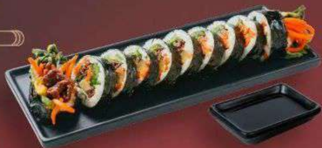
5.1. Кимпаб с Говядиной 359 Р

200 г - Рис, нори, говядина, редька маринованная, морковь, огурец, салат, соевый соус