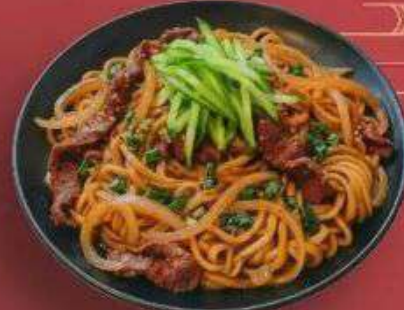
3.2. Удон с Говядиной 389 Р

330 г - Свежая лапша, шеф соус, зелёный лук, курицей, репчатый лук, огурец