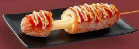
6.5. Хотдог с сыром Моцарелла 269 Р

170 г - Сосиска, мука, дрожжи, кетчуп, сырный соус, майонезный соус