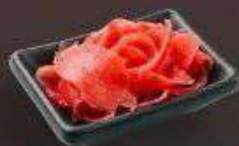
5.7. Маринованный имбирь 39 Р

230 г - Рис, нори, темпура с креветкой, редька маринованная, морковь, огурец, салат, сухари панировочные, соевый соус