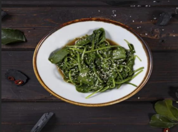
Шпинат Шпинат, кунжут 150 гр