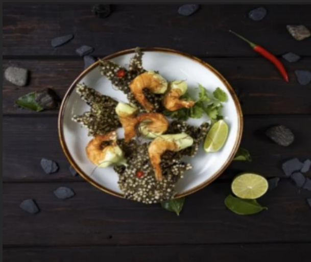
Креветки васаби Креветки, клер, крем «Васаби», перец чили, чипсы из тапиоки, кинза