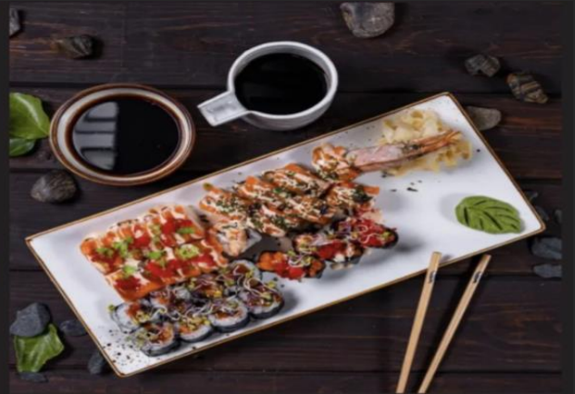
Сэт Салмон Дракон ролл, Нейкед салмон, Салмон маки, гунган Салмон 3 шт