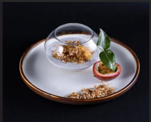
Пудинг с семенами чиа и манго Семена чиа, манго консервированное, маракуйя