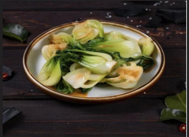
Пак-чой Пак-чой 150 гр