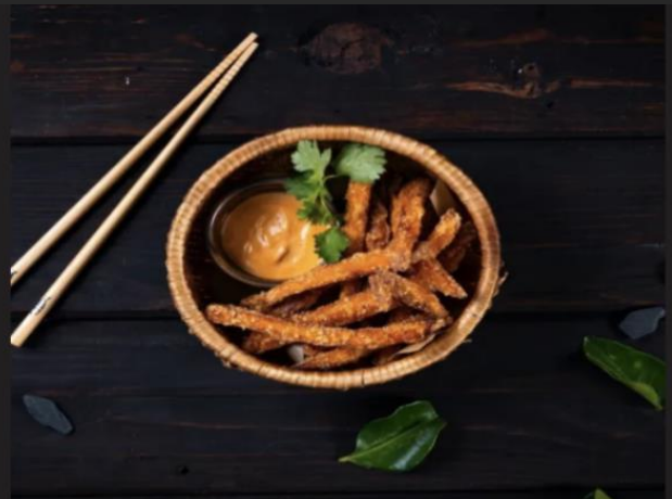
Батат фри Батат 150 гр