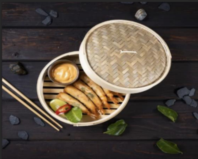
Спринг-роллы с креветками Креветки, тесто жарумаки, соус «Шрирача», перец чили, лайм