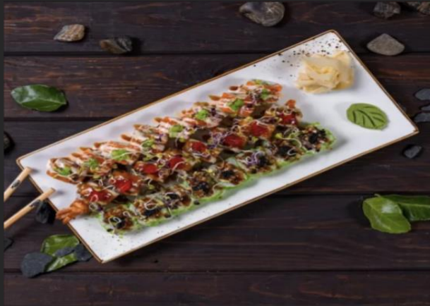
Сэт Унаги Канада ролл, Такио ролл, Дракон ролл