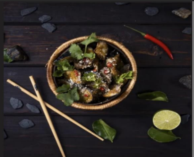
Хрустящие баклажаны Баклажаны, крамал, соус «Роджак», перец чили, кунжут, ореки кешью, кинза