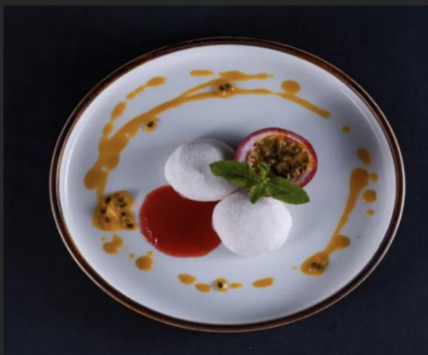
Моти Рисовая мука, крахмал кукурузный, сыр «Креметте», ваниль, соус клубничный, маракуйя свежая, соус из маракуй