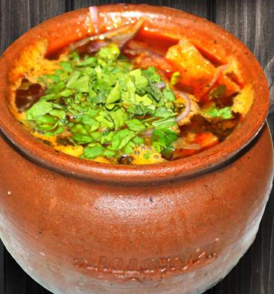
ЧАНАХИ БАРАНИНА, ЛУК, КАРТОФЕЛЬ, БАКЛАЖАНЫ, ТОМАТ 530 - 350Г