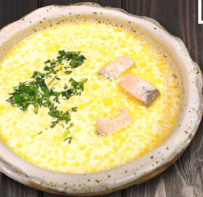
УХА ПО-ФИНСКИ 500 - 350Г