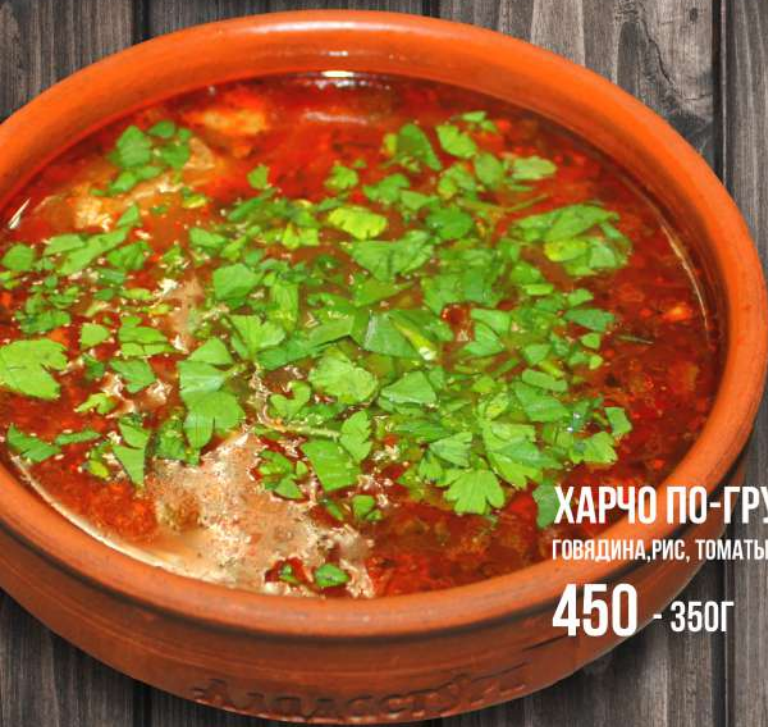
ХАРЧО ПО-ГРУЗИНСКИ ГОВЯДИНА, РИС, ТОМАТЫ, ЧЕСНОК, ЗЕЛЕНЬ 450 - 350Г