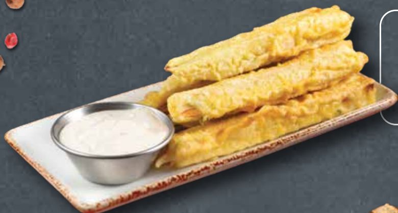
БАКЛАЖАНЫ ФРИ С СОУСОМ ИЗ ПЕЧЁНОГО ЧЕСНОКА 450 FRIED EGGPLANT