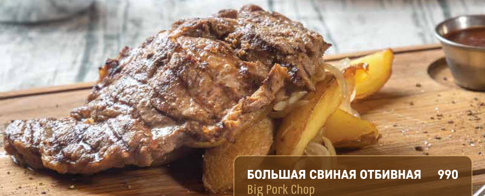
БОЛЬШАЯ СВИНАЯ ОТБИВНАЯ 990 Big Pork Chop