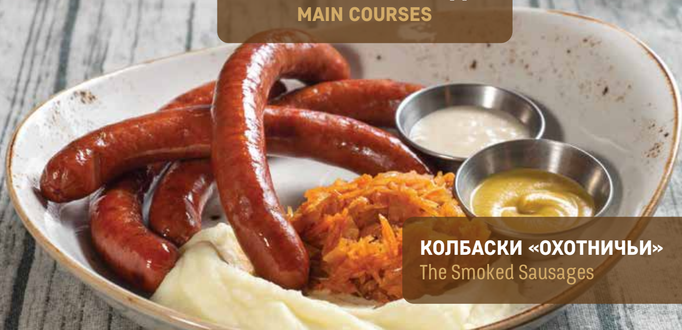
КОЛБАСКИ «ОХОТНИЧЬИ» 720 The Smoked Sausages