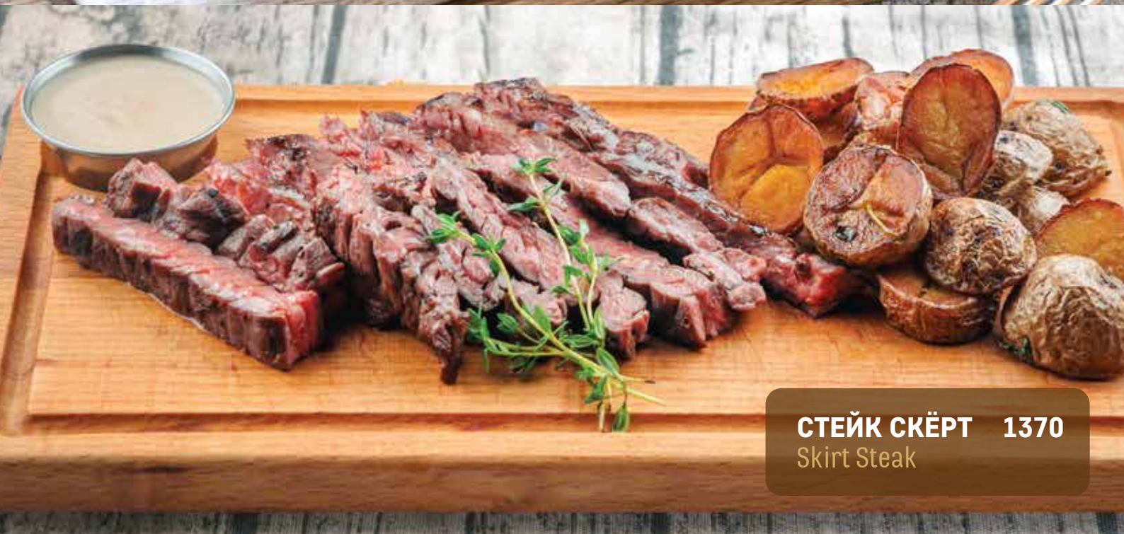
СТЕЙК СКЁРТ 1370 Skirt Steak