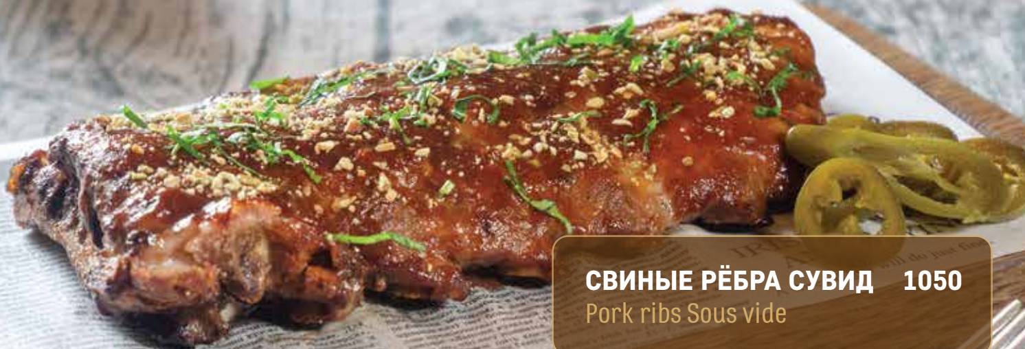
СВИНЫЕ РЁБРА СУВИД 1050 Pork ribs Sous vide