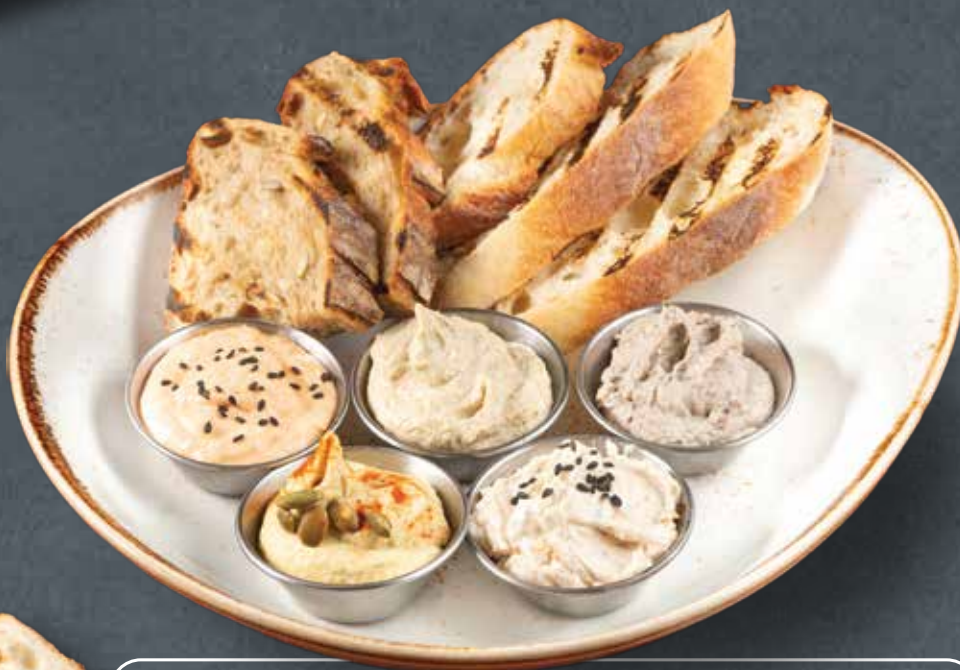
АССОРТИ ПАШТЕТОВ 680 ПАШТЕТ С БАГЕТОМ 350