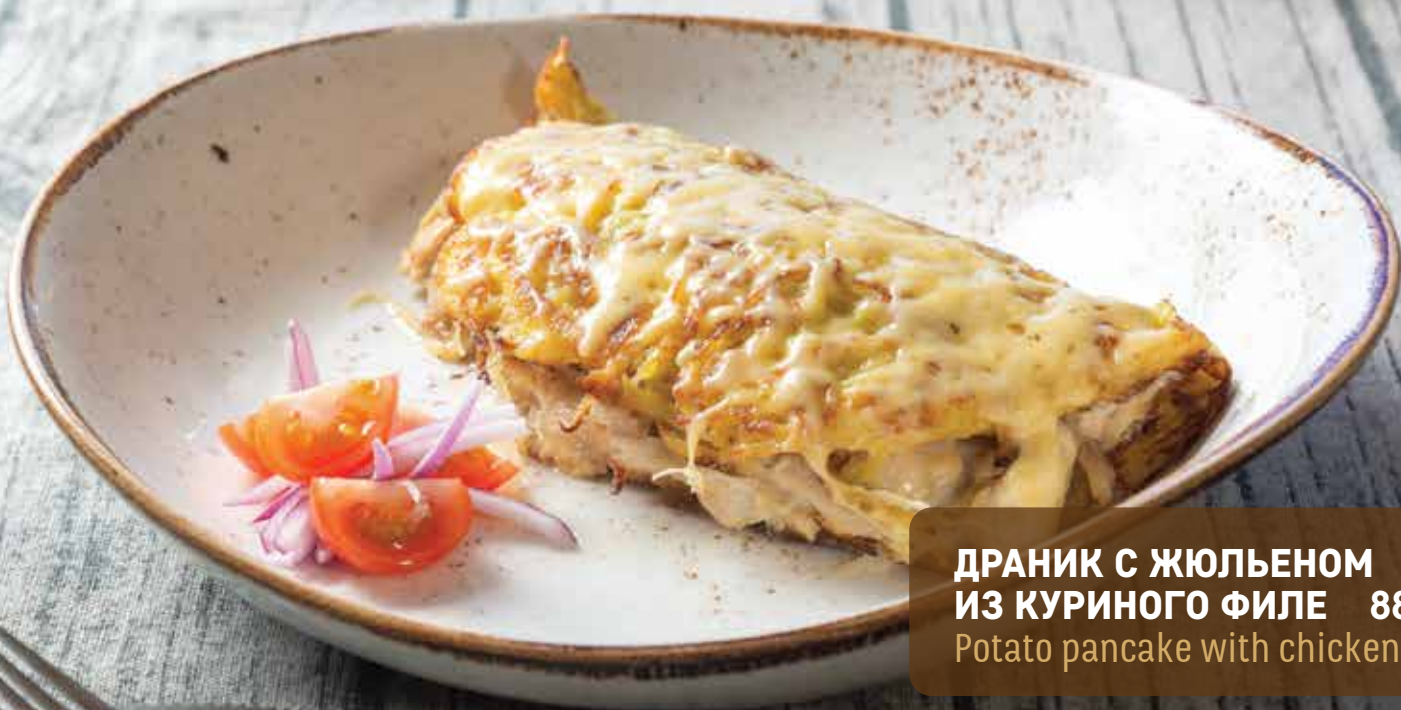
ДРАНИК С ЖЮЛЬЕНОМ ИЗ КУРИНОГО ФИЛЕ 880 Potato pancake with chicken