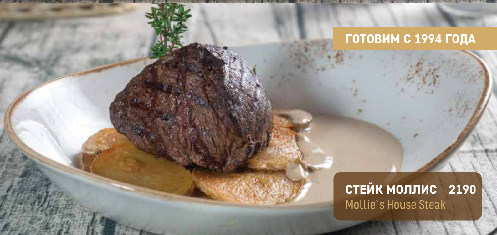
СТЕЙК МОЛЛИС 2190 Mollie's House Steak